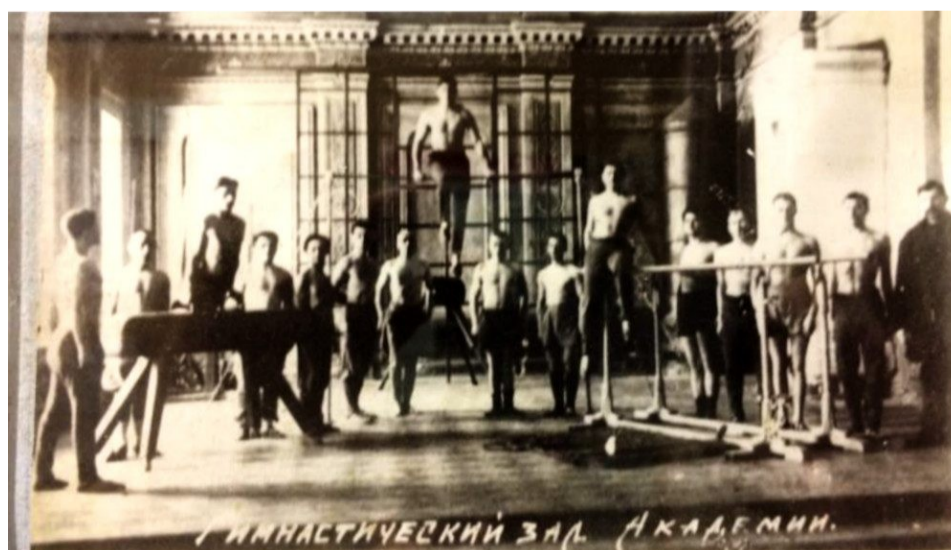
Группа слушателей академии в гимнастическом зале академии

Для студентов стали проводиться необязательные занятия по гимнастике, фехтованию, конькам, городкам и верховой езде. Местом проведения был избран зал в ортопедической клинике и академический зал на улице Боткинской, 1. Именно с 1900 г. по праву принято считать введение в образовательный процесс академии занятий по физическому воспитанию.