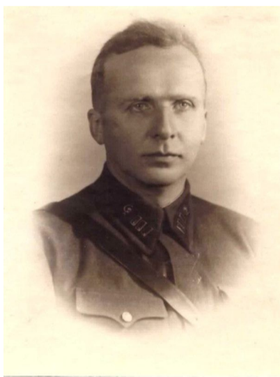
БИРЗИН Георгий Карлович